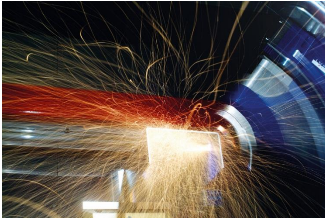
Bild 1: Der Laser-Kombikopf schneidet, vermisst und schweißt metallische Bauteile ohne Werkzeugwechsel.